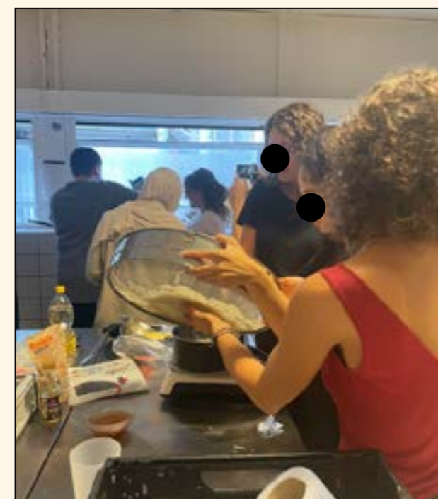
Observation d'un atelier Fest1 organisé par l'association COP1

À travers nos différentes actions de sensibilisation, nous avons cherché à transmettre des compétences culinaires, au moyen d'astuces de cuisine, de découvertes des aliments, de recettes, etc.